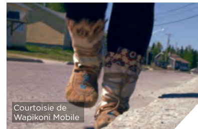
Une scène tirée de Rien sur les mocassins , un des films projetés à un événement Indigénous 150+.

World Folk Music Ottawa offre des programmes musicaux et artistiques à ceux et celles qui autrement ne pourraient se permettre l'accès à ces services. L'an dernier, l'organisme a offert aux enfants et aux jeunes des quartiers Confederation Court et de la rue Donald l'occasion de prendre des cours de chant et de musique. Le projet de chorale Everyone's Children Choir comprenait des cours de chant, des répétitions de chorale et la chance de participer à des représentations publiques.